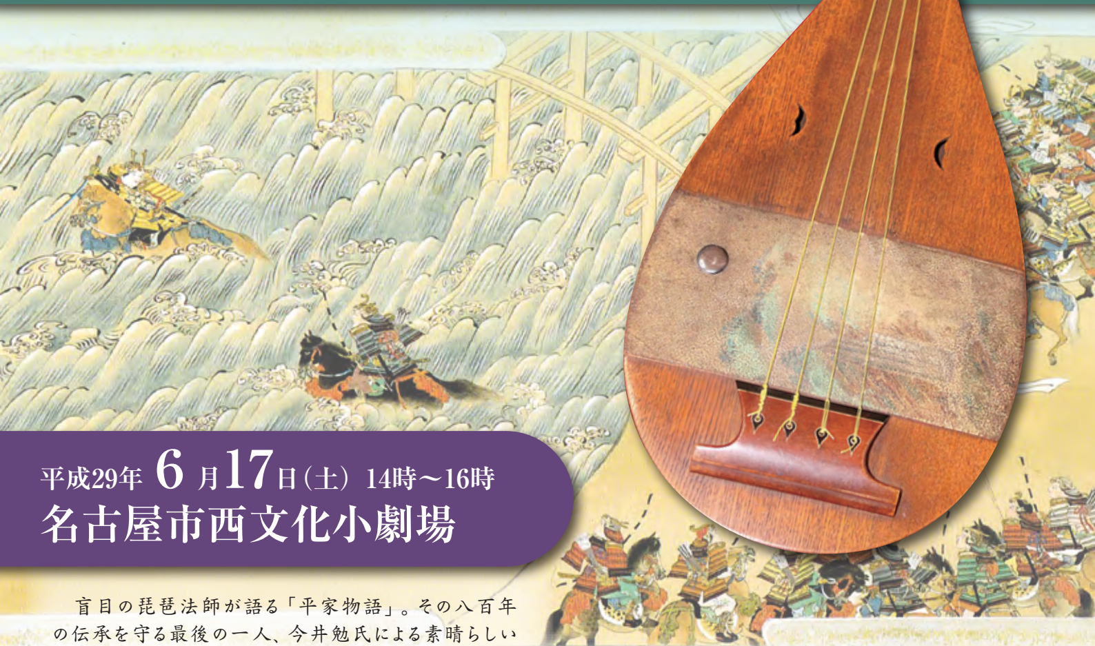
宇治川先陣之図「平家物語絵巻」林原美術館蔵